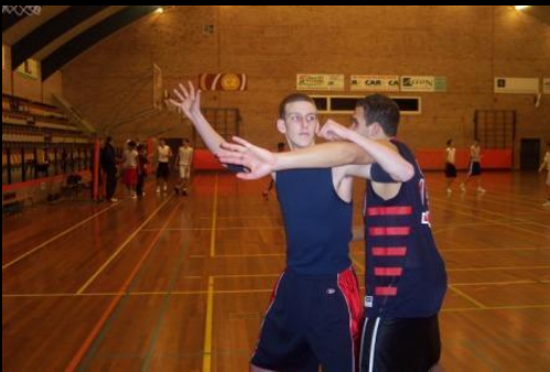
Arm Battle : onderarm klemmen.

Je kunt nog eens stapje verder gaan en jouw bovenarm helemaal onder zijn bovenarm plaatsen, waarbij je hand zich aan de buitenkant van zijn bovenarm bevindt. Als je nu je onderarm naar je toe haalt klem je de arm van de verdediger vast. Dit laatste is natuurlijk niet volgens de regels, maar het gaat er hierom dat je de grenzen zoekt die de scheidsrechter stelt.