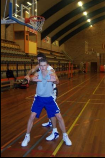
De verdediger staat aan de achterkant