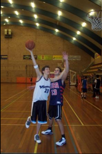
Hookshot : met inside arm leunen op borst verdediger (zoek het contact)

basket. Is de bal boven je hoofd dan haal je je inside hand weg van de bal en vormen je twee armen als het ware de letter "V". Ga zo dicht mogelijk naar de ring en zoek het contact met je verdediger. Je inside arm "rust" dan op de borst van de verdediger en biedt zo een goede bescherming.